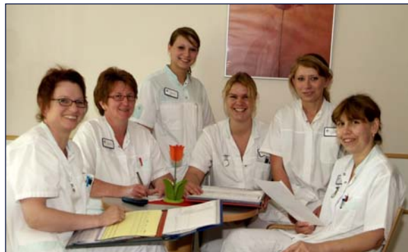
Ein Pflegeteam der Station